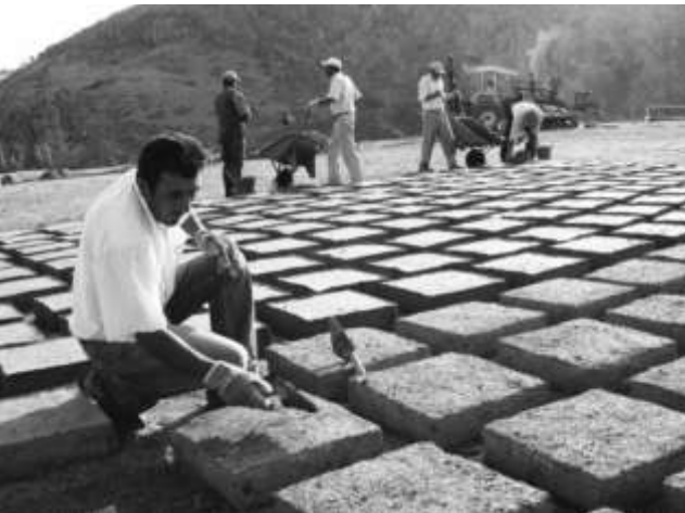
Bir yüzü kuruyan kerpiçler daha iyi kurumaları için çevrilir.

Im Sommer 2003 begann in der hethitischen Hauptstadt Hattuša/Boğazköy ein neues Rekonstruktionsprojekt: Ein Abschnitt der Lehmziegelstadtmauer in der Unterstadt soll möglichst naturgetreu mit damals vorhandenen Materialien wiedererrichtet werden. Die genaue Dokumentation der Arbeiten ist ebenso Teil dieses Projekts wie später die Beobachtung der fertigen Anlage und die Feststellung des jährlichen Pflegebedarfs. Damit wird es möglich, die Bauplanung und -ausführung sowie Fragen der Unterhaltung in