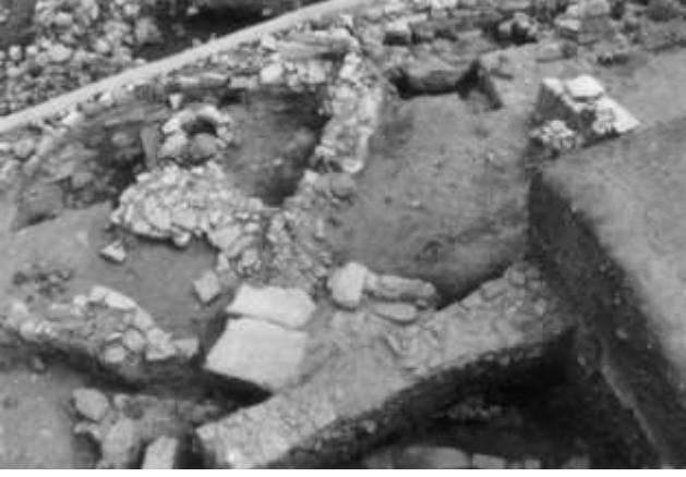
Klazomenai, P1 Yapısı

bugüne dek yeterince bilinmeyen bir dönemine ışık tutan bu buluntu nedeniyle, Klazomenai'de son yıllardaki kazı çalışmaları, Protogeometrik Dönem'e ait yerleşim izlerinin araştırıldığı bu alanda yoğunlaştırılmıştır. Erken Tunç Çağı II. Dönemi'ne tarihlenen surun güneye doğru uzanan enkazı içinde yer alan, ana aksı doğu-batı doğrultusunda olan ve batı ucunda apsis oluşturan bu yapı P1 yapısı olarak adlandırılmıştır. Geç dönem yerleşimleri tarafından yoğun bir şekilde tahribe uğratılmış olan yapının ilk evresine ait duvar temelleri dikey yerleştirilmiş yassı taş sıralarının kısmen toprağa gömülmesiyle oluşturulmuştur. Yapının üst bölümünün kerpiç olduğu düşünülmektedir. Yapı içerisinde izlenen yanık kerpiçli kil taban, yapının ilk evresinin bir yangınla sona erdiğini göstermiştir. Bu taban üzerinde in-situ durumda ele geçen seramiklerin yardımıyla yapıyı M.Ö. 11. yy'ın sonu ile 10. yy'ın ortalarına tarihlenmek mümkün olmaktadır. İkinci evrede yapı bir duvarla ortadan ikiye bölünmüştür. Geç dönem tahripleri sebebiyle ikinci evreye ait kesin veriler elde edilememiştir. Ancak, bölme duvarının ilk evreye ait yanık kerpiçli tabanının ve üzerindeki seramiklerin hiç boşluk bırakmadan hemen üzerine yerleştirilmesi, ikinci evrenin de Protogeometrik Dönem'e ait olduğunu göstermektedir.