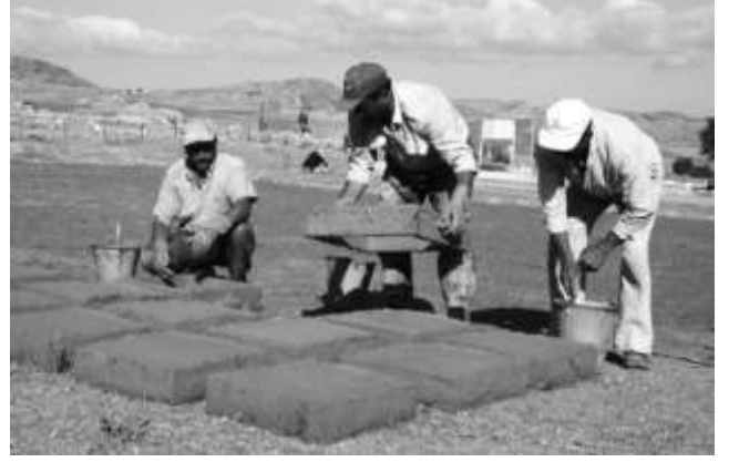
Çamur dinlendirildikten sonra tahta kalıplar içine dökülür.