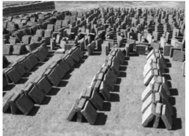
Dik yerleştirilen kerpiçler rüzgarın yardımıyla tamamen kurutulur.