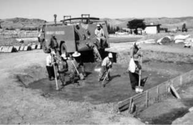
Büyük çukurlar içinde kerpiç toprağı; saman ve su ile karıştırılır.