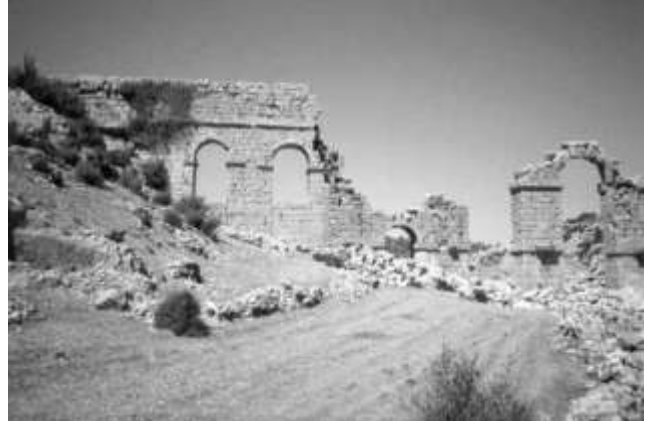
Olba akropolisinin doğusunda, Roma İmparatoru Septimius Severus Dönemi'ne tarihlenen aqueductus.

Olba, Erken Hıristiyanlık Dönemi'nde Seleukeia