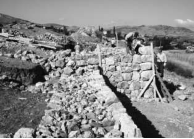
Taş temel ve subasman kesiminin yapımı.

olacaktır; 3. Hitit Dönemi'ne ait sur modelleri vardır ve bunlar mimari detayların rekonstrüksiyonu için yol göstericidir.