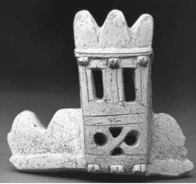
Hattuşa'da bulunan sur modeli. Mazgal dişleri, kule pencereleri, ahşap hatıllar gibi ayrıntılar belirtilmiştir.